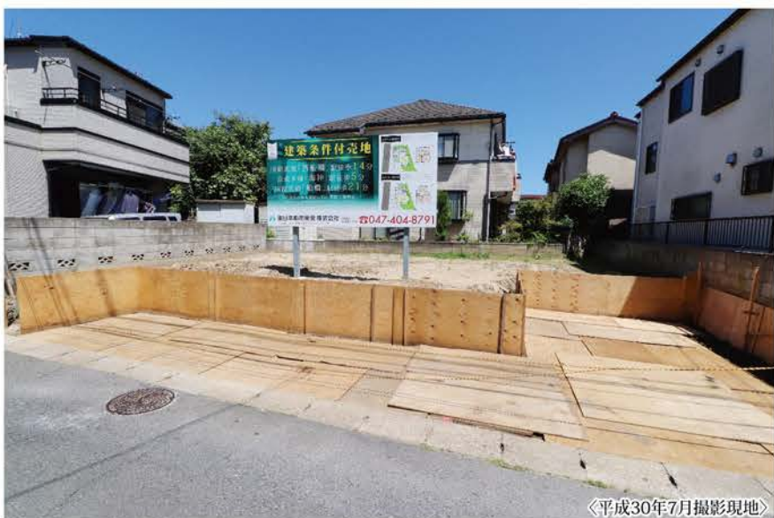
〈平成30年7月撮影現地〉