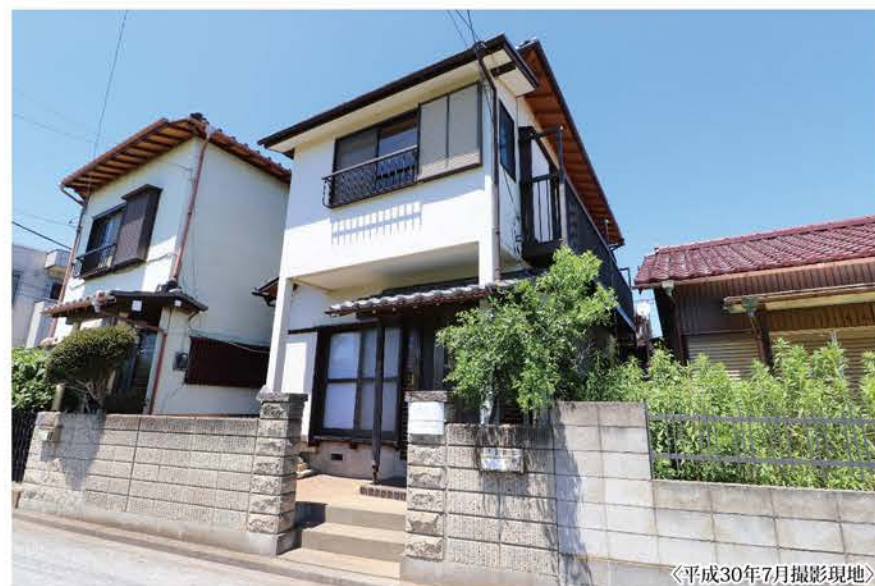
〈平成30年7月撮影現地〉